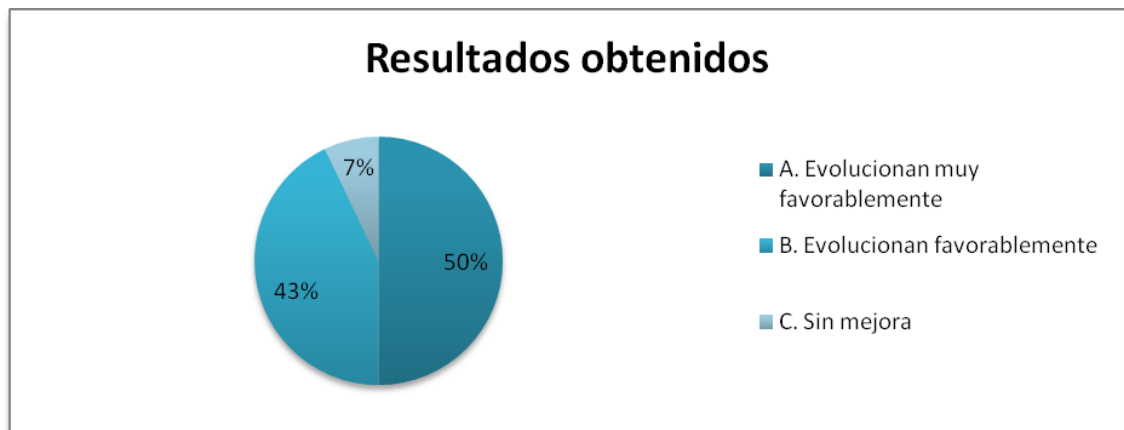
Tabla I: Resultados obtenidos